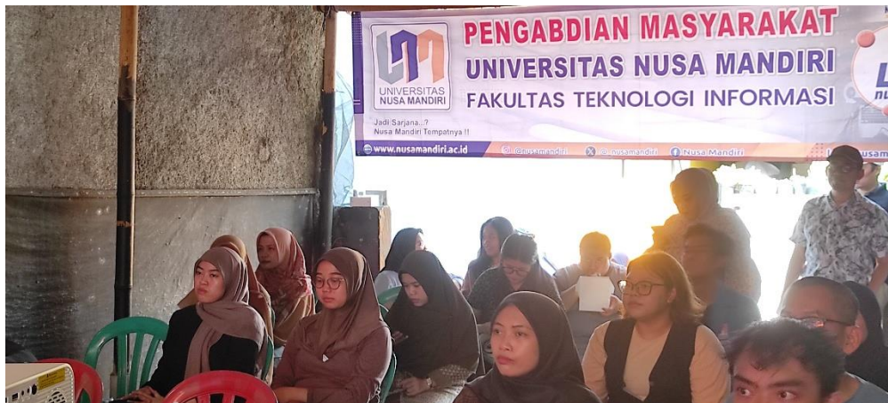
Gambar 3. Pelaksanaan Pelatihan WordPress

pengetahuan yang diperoleh sesuai dengan kebutuhan usaha masing-masing. Selain itu, sesi tanya jawab dan diskusi dilakukan untuk memberikan ruang bagi peserta dalam menyampaikan kendala serta memperoleh solusi secara langsung.