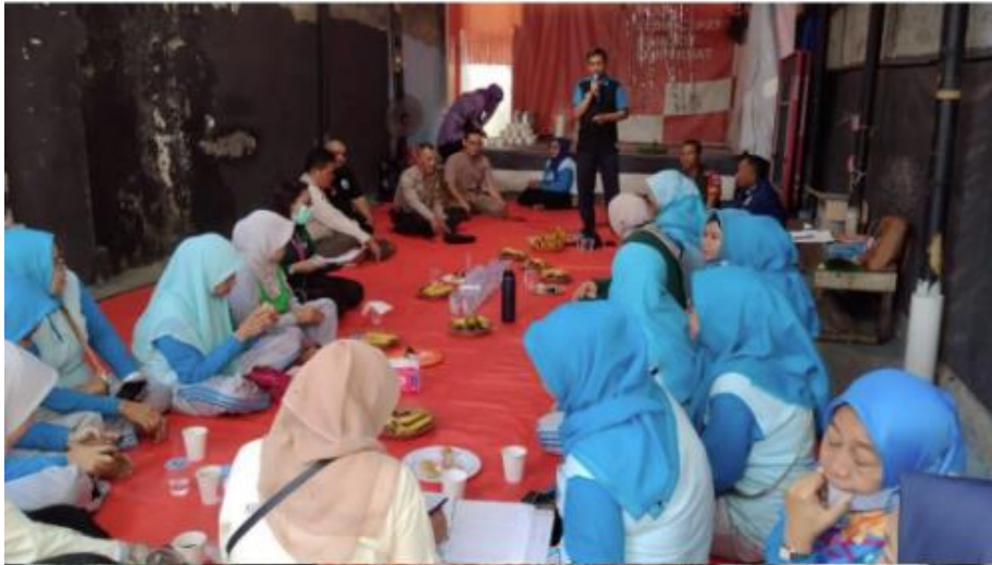
Gambar 2. Foto kegiatan Mitra

Peserta kegiatan pengabdian masyarakat ini adalah pelaku UMKM warga RT 05 Cikoko yang aktif menjalankan usaha skala mikro dan kecil. Peserta yang terlibat dalam kegiatan ini berjumlah 11 orang, dengan latar belakang jenis usaha yang beragam. Pelaku UMKM dipilih sebagai mitra karena memiliki kebutuhan langsung terhadap peningkatan kemampuan promosi produk melalui pemanfaatan teknologi digital. Dokumentasi pelaku UMKM RT 05 Cikoko dalam kegiatan pertemuan rutin dapat dilihat pada Gambar 2.