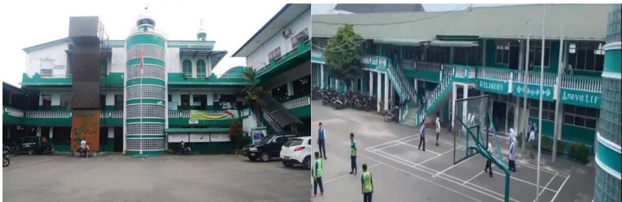
Gambar.1. Lokasi Pengabdian, MTS. Lab. IKIP Al-Washliyah Medan

Pelaksanaan kegiatan pengabdian kepada masyarakat di MTS. Lab. IKIP Al-Washliyah Medan menunjukkan hasil yang positif dan signifikan terhadap peningkatan pemahaman guru mengenai digitalisasi keuangan syariah. Kegiatan yang diikuti oleh para guru yang berjumlah 10 orang guru berlangsung secara interaktif, sebagaimana terlihat pada gambar di atas, di mana peserta tidak hanya mendengarkan pemaparan materi, tetapi juga terlibat langsung dalam simulasi penggunaan aplikasi keuangan syariah digital melalui perangkat telepon pintar dan laptop.