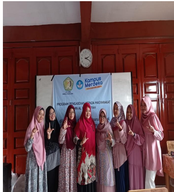
Gambar.3. Memberikan Pelatihan Terkait dengan Keuangan Syariah

Dalam sesi simulasi, guru secara aktif mempraktikkan penggunaan aplikasi keuangan syariah digital, mulai dari proses registrasi, eksplorasi fitur pembayaran, transfer, hingga simulasi pencatatan transaksi. Antusiasme peserta terlihat dari keterlibatan langsung menggunakan perangkat masing-masing. Pendekatan praktik langsung ini terbukti efektif dalam meningkatkan kepercayaan diri guru untuk memahami teknologi finansial berbasis syariah. Selain peningkatan aspek kognitif, kegiatan ini juga menghasilkan perubahan pada aspek afektif dan sikap. Guru menunjukkan kesadaran yang lebih kuat mengenai pentingnya literasi keuangan sejak dini bagi siswa. Dalam sesi refleksi, beberapa guru menyampaikan komitmen untuk mulai mengintegrasikan materi literasi keuangan syariah dalam pembelajaran, baik melalui contoh kasus, proyek sederhana pengelolaan keuangan siswa, maupun diskusi kontekstual pada mata pelajaran yang relevan. Perubahan pemahaman tersebut dapat di lihat dari data berikut: