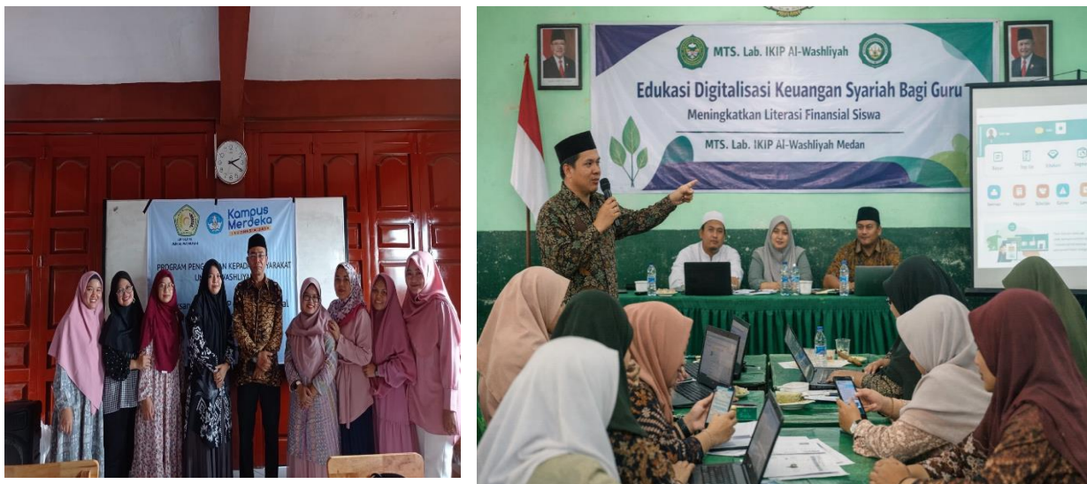
Gambar.5. Foto Bersama dan Memaparkan Hasil Evaluasi

Grafik setelah pelatihan menunjukkan peningkatan pada seluruh indikator. Pemahaman konsep keuangan syariah meningkat menjadi 85%, kemepuan integrasi ke pembelajaran menjadi 80%, penguasaan aplikasi digital mencapai 78% dan administrasi keuangan digital menjadi 82%. Rata-rata kompetensi guru setelah sosialisasi meningkat menjadi 81,25%. Hasil ini menunjukkan bahwa pelatihan dan pendampingan yang dilakukan efektif dalam meningkatkan kapasitas guru.